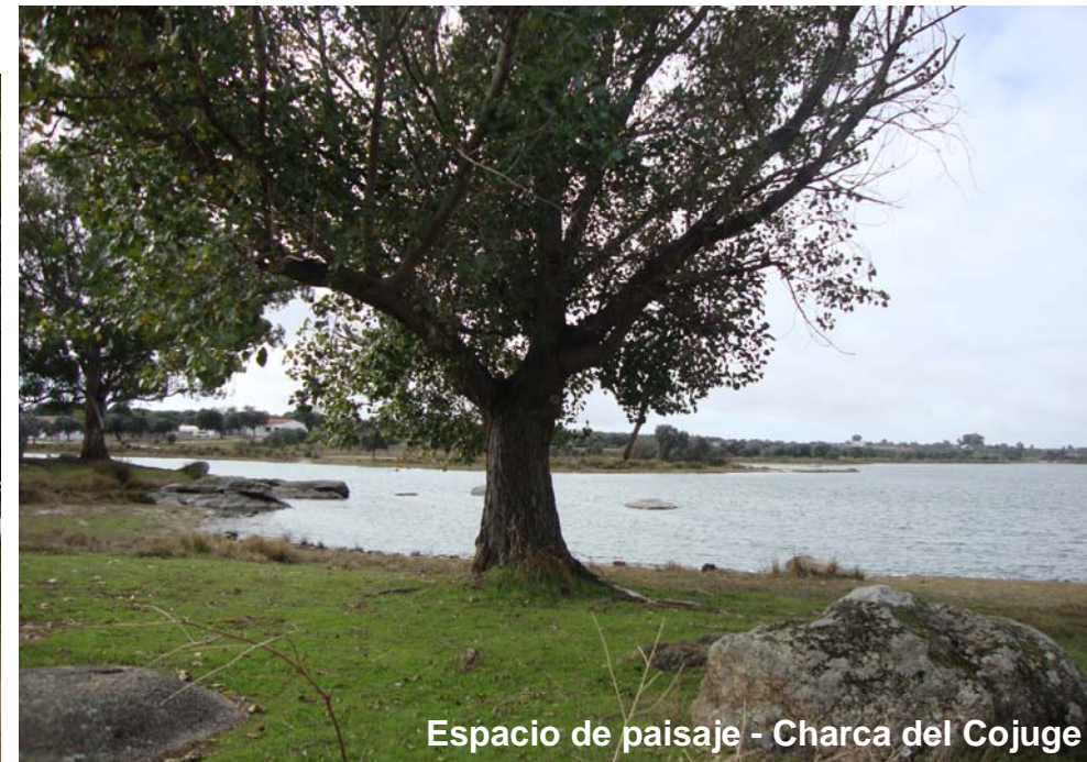
Espacio de paisaje - Charca del Cojuge