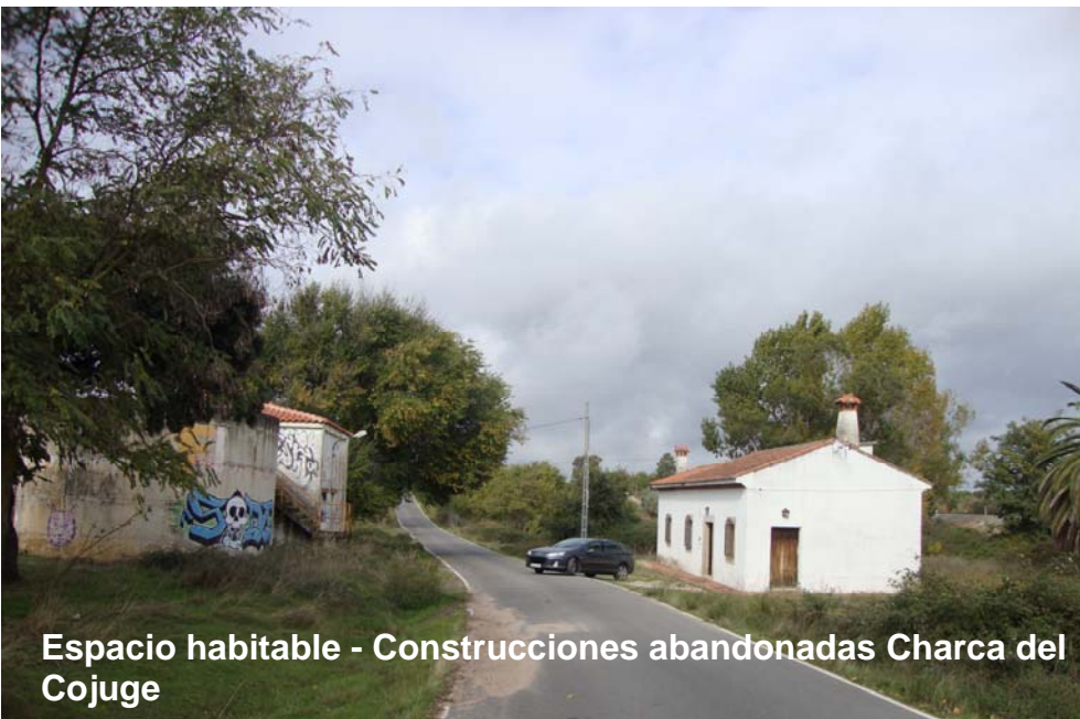
Espacio habitable - Construcciones abandonadas Charca del Cojuge