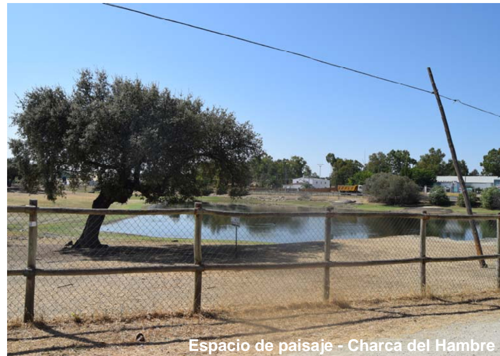
Espacio de paisaje - Charca del Hambre