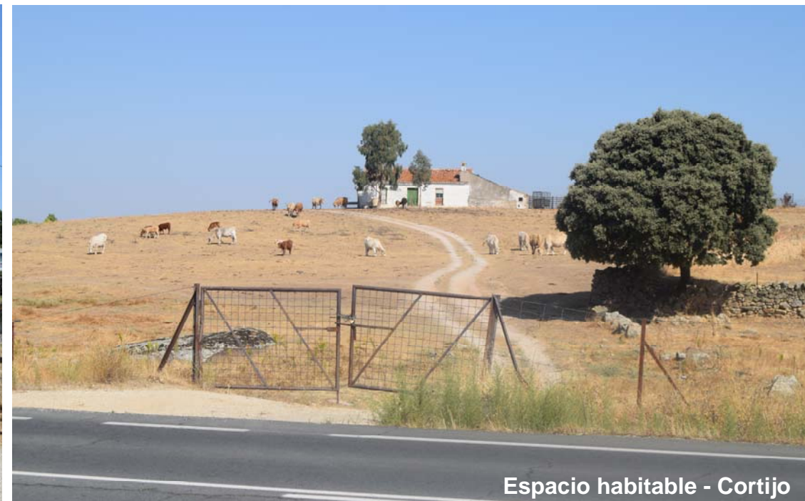
Espacio habitable - Cortijo