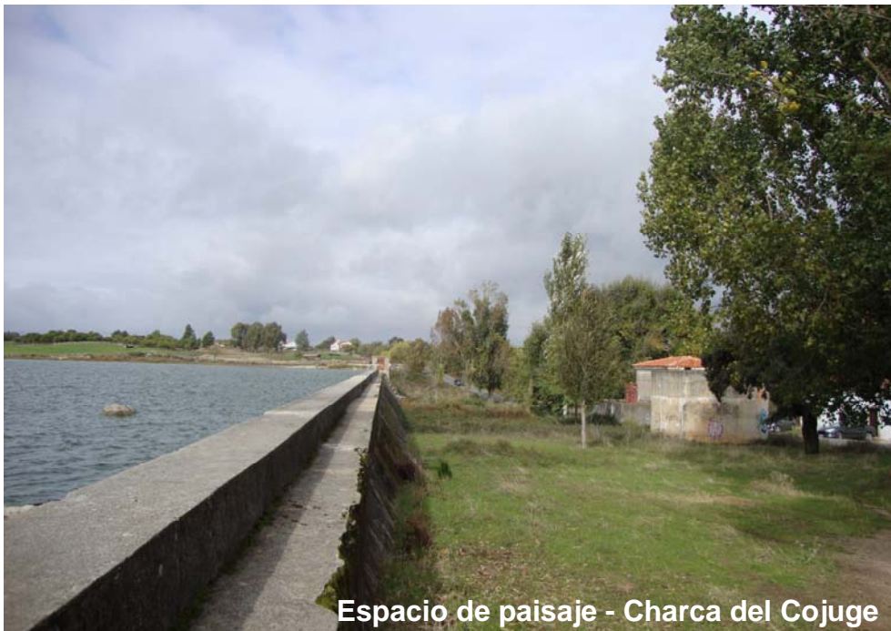
Espacio de paisaje - Charca del Cojuge