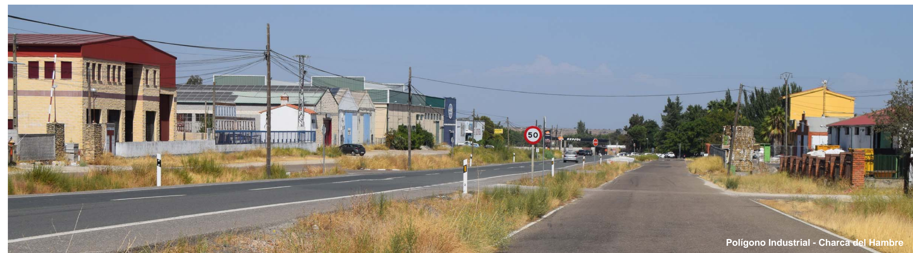
Polígono Industrial - Charca del Hambre