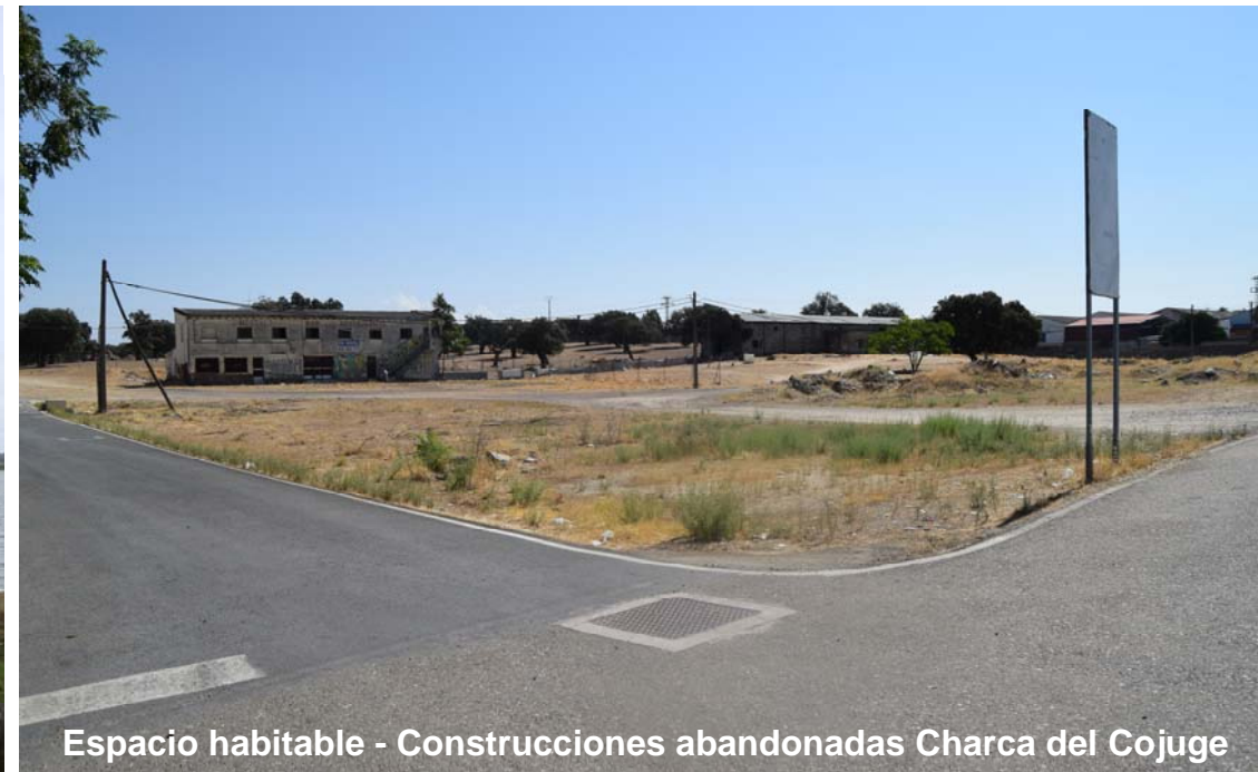
Espacio habitable - Construcciones abandonadas Charca del Cojuge