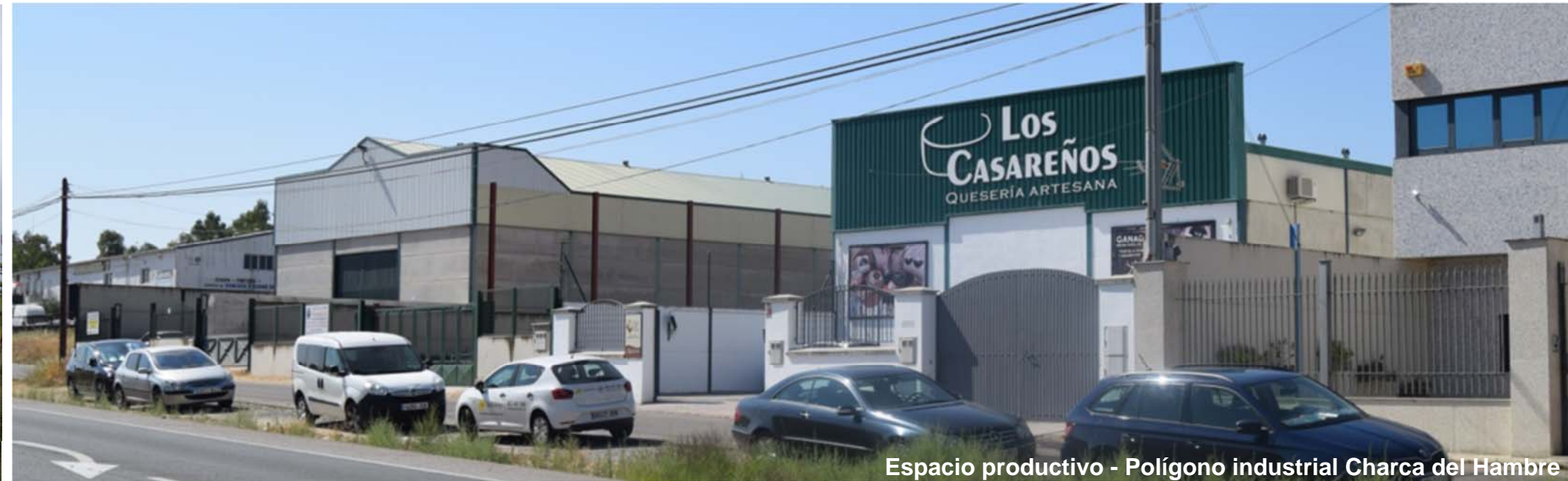
Espacio productivo - Polígono industrial Charca del Hambre