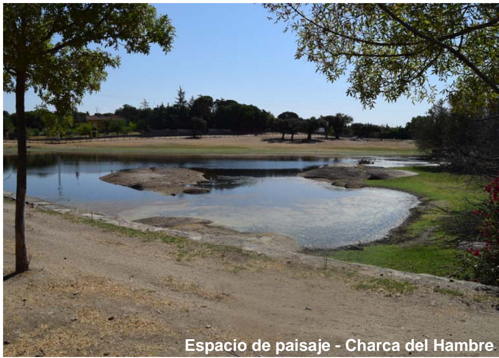
Espacio de paisaje - Charca del Hambre