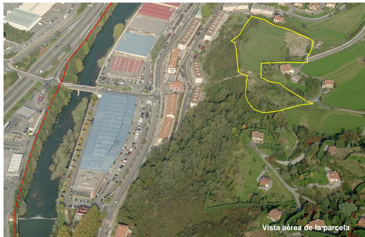
Vista aérea de la parcela