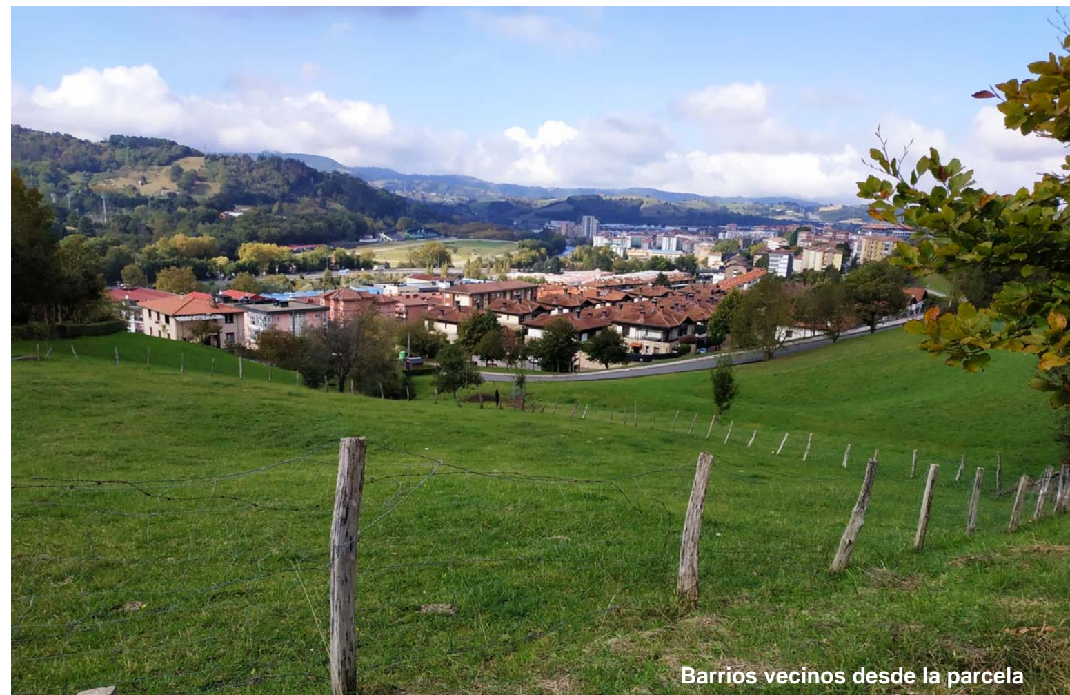
Barrios vecinos desde la parcela