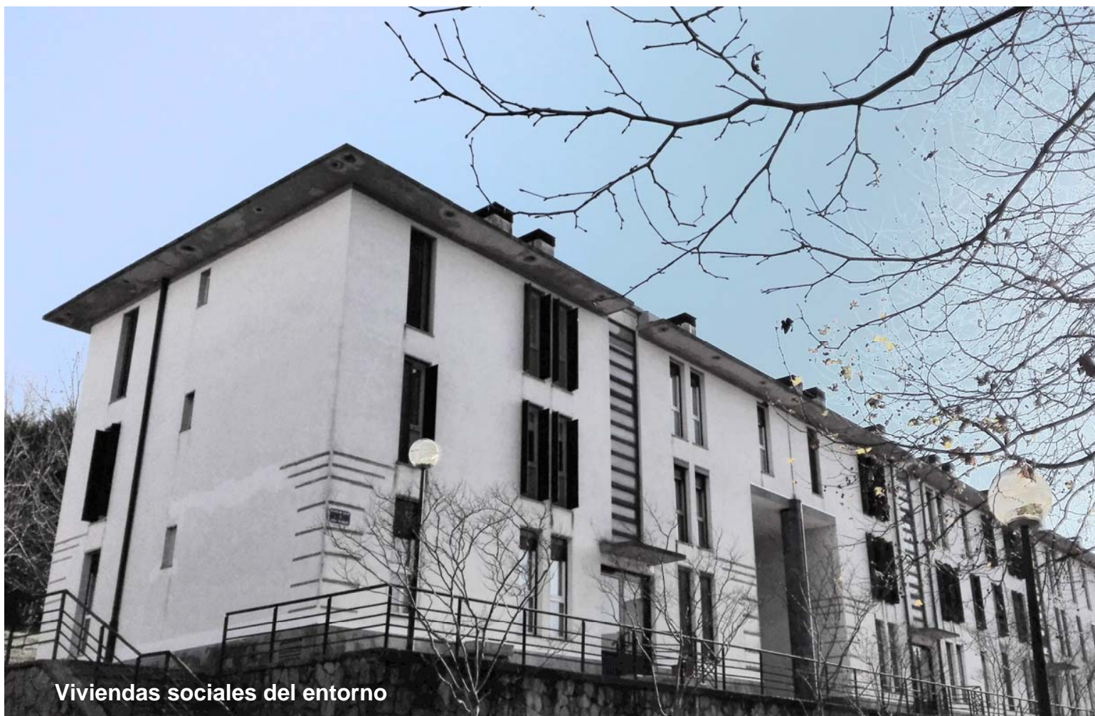
Viviendas sociales del entorno