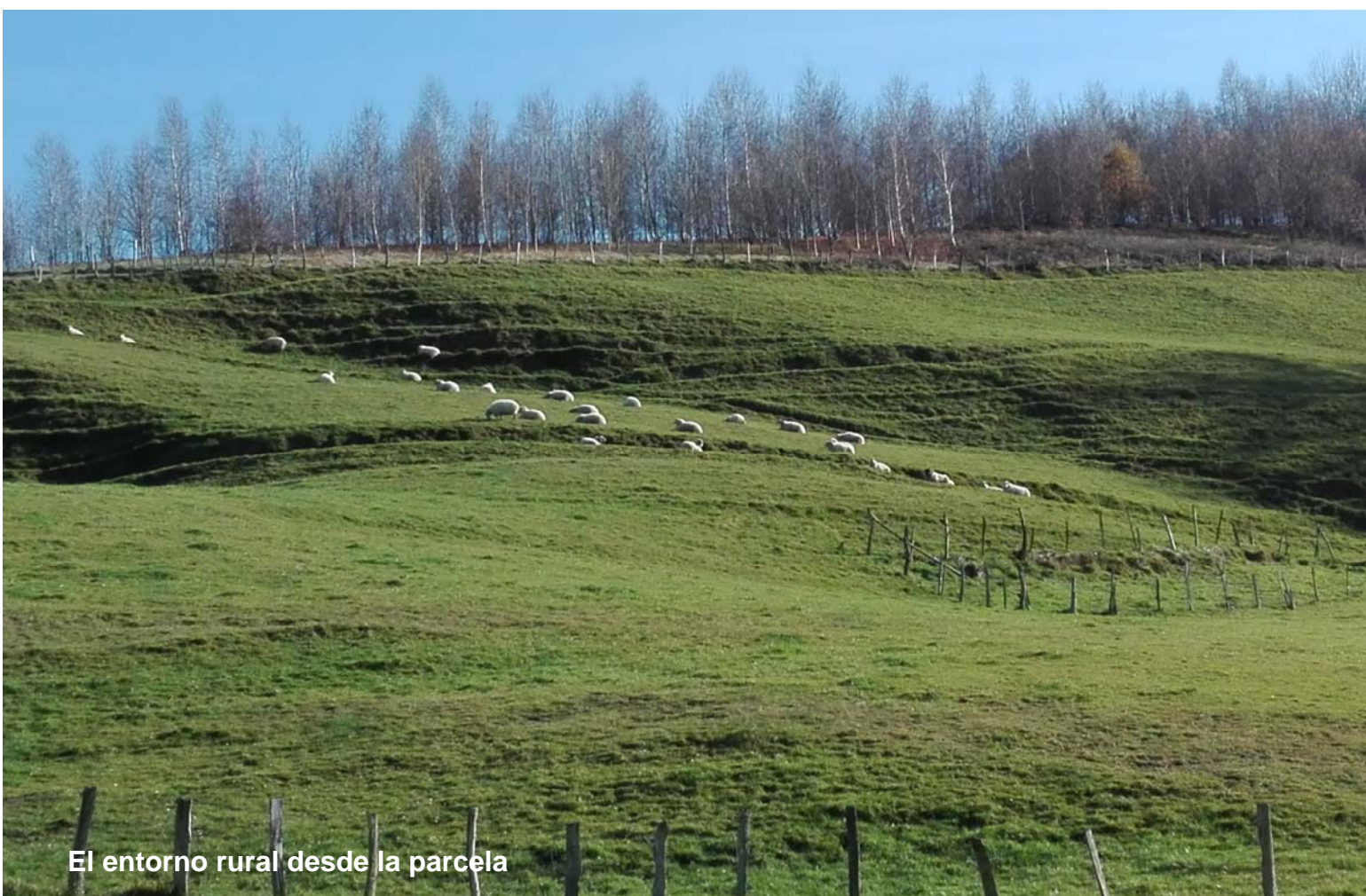
El entorno rural desde la parcela