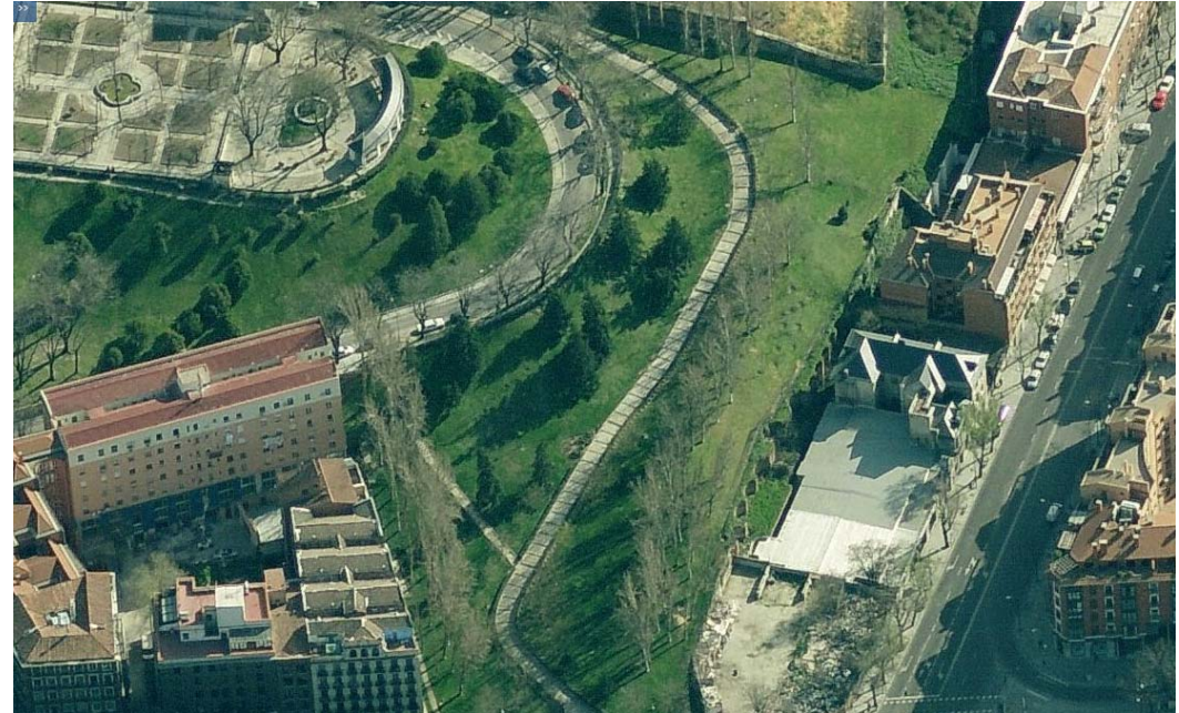
A- Vista aérea del emplazamiento, desde la Iglesia de San Francisco C- Vista aérea del terreno del Arzobispado desde Las Vistillas