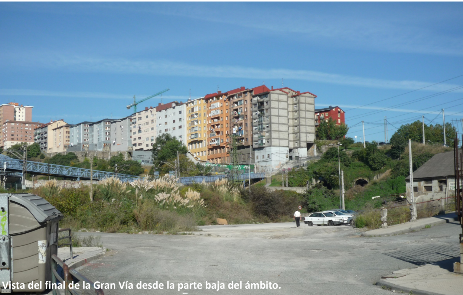
Vista del final de la Gran Vía desde la parte baja del ámbito.