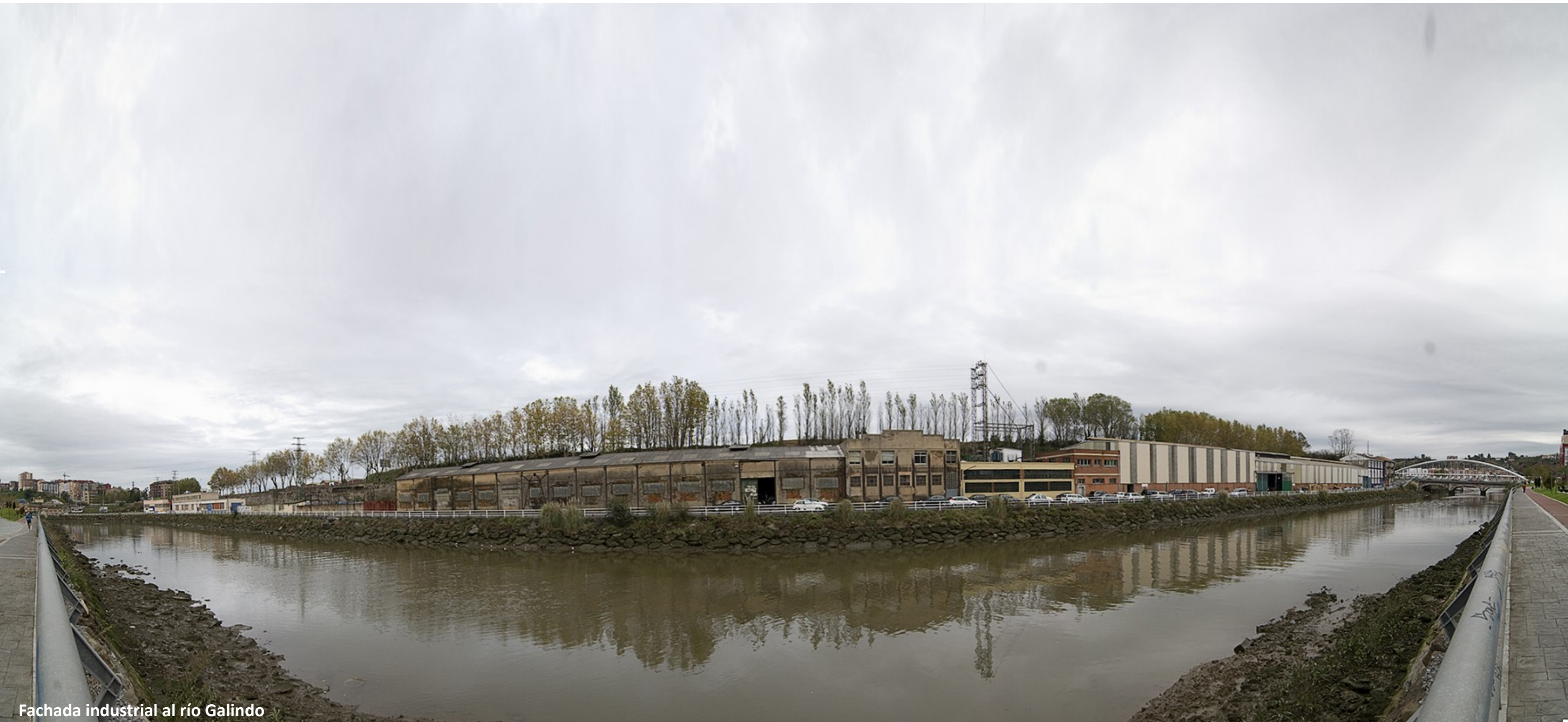
Fachada industrial al río Galindo