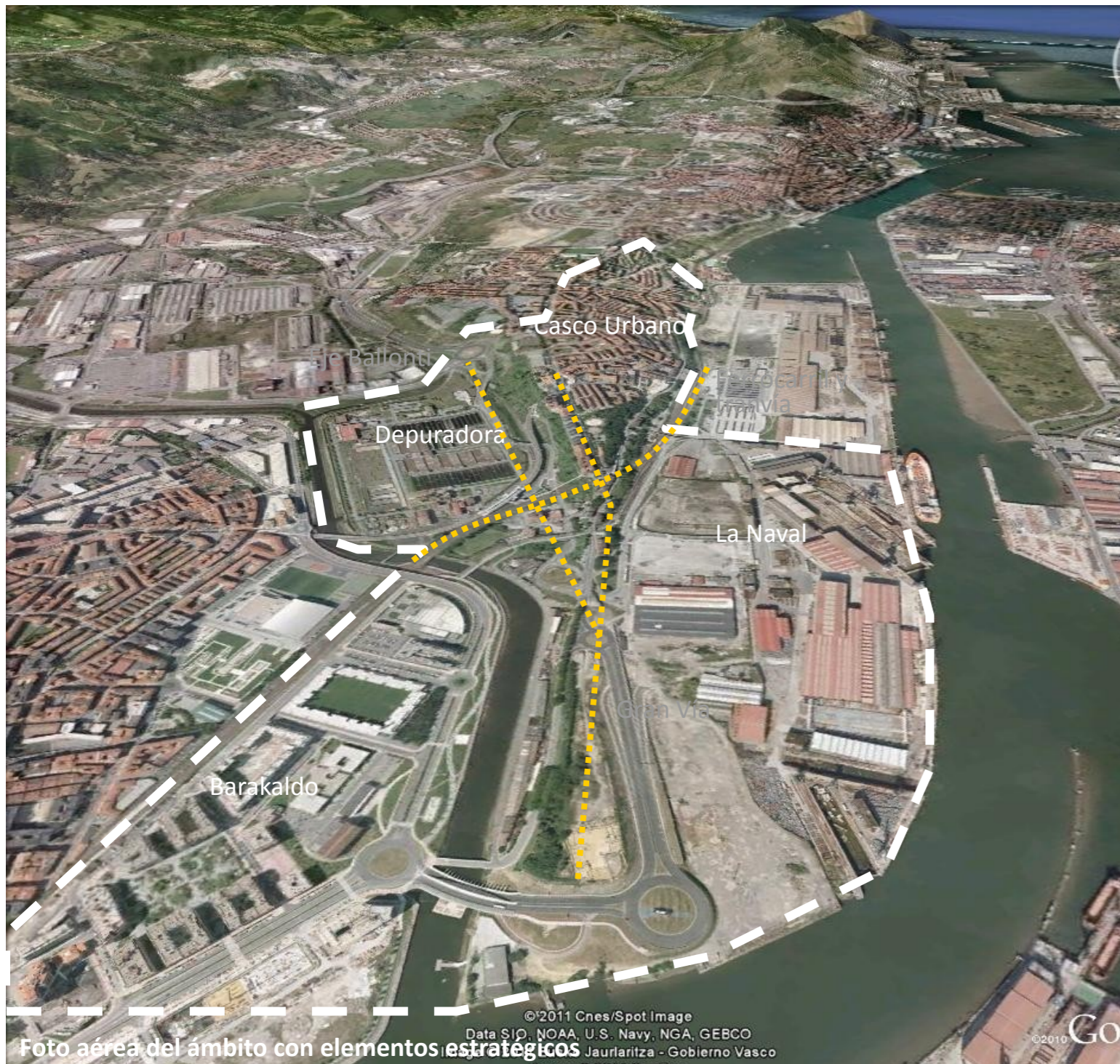
Foto aérea del ámbito con elementos estratégicos