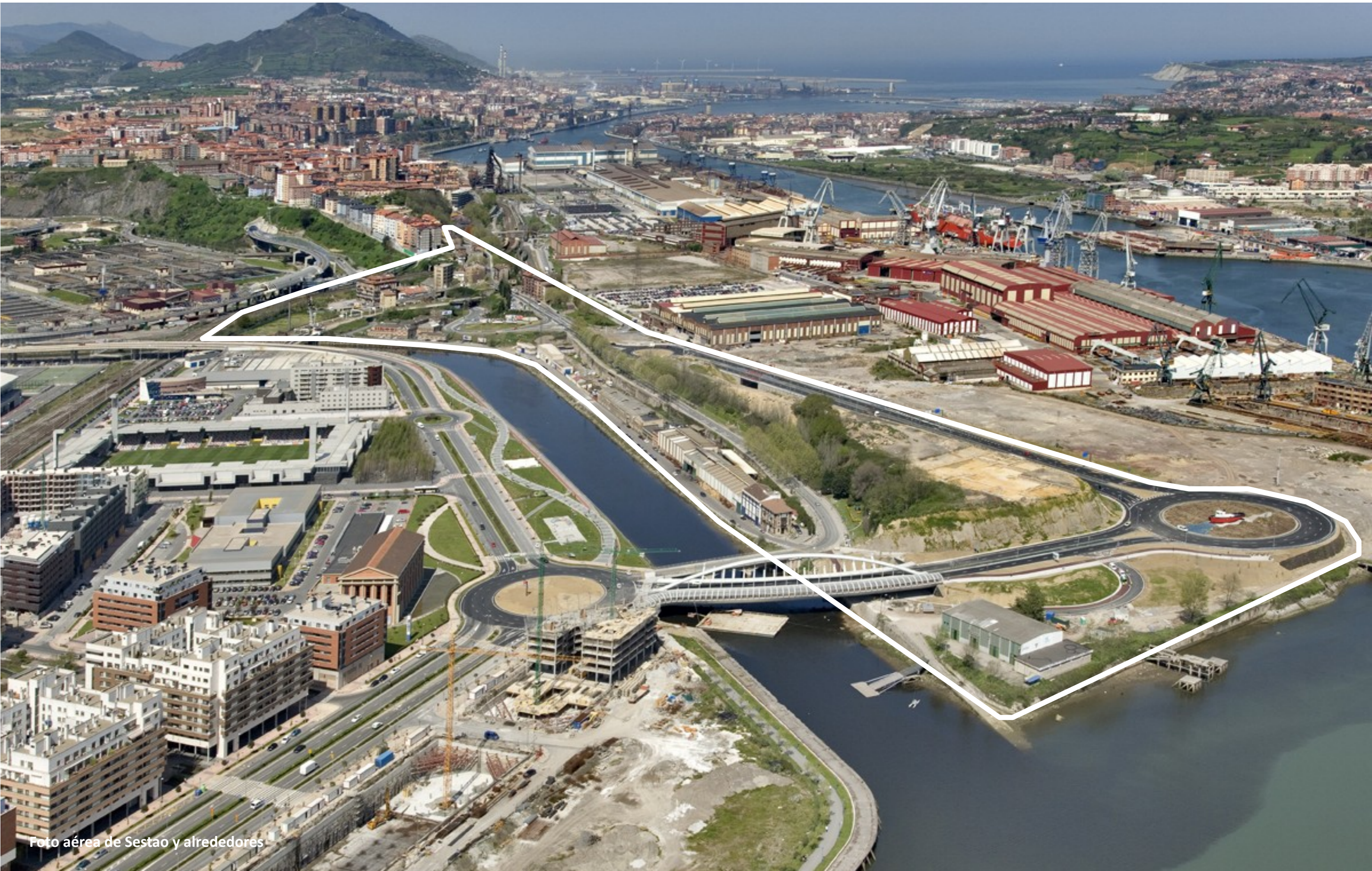
Foto aérea de Sestao y alrededores