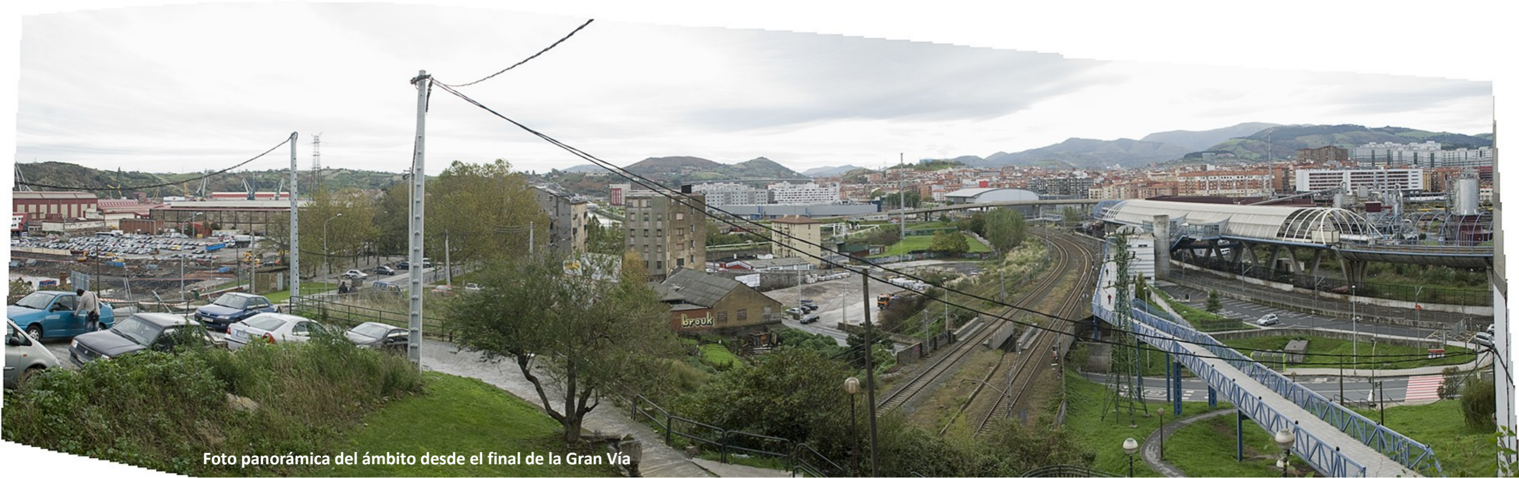
Foto panorámica del ámbito desde el final de la Gran Vía