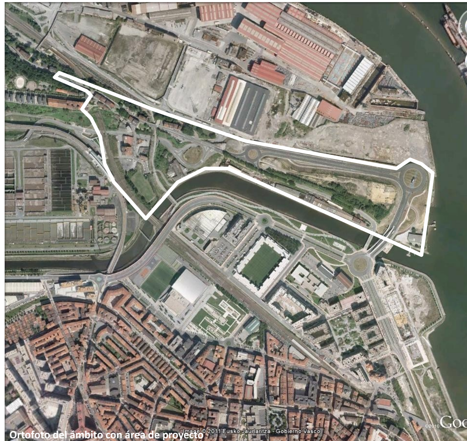
Ortofoto del ámbito con área de proyecto